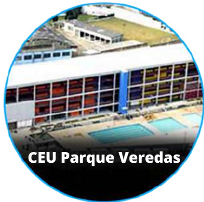
CEU Parque Veredas