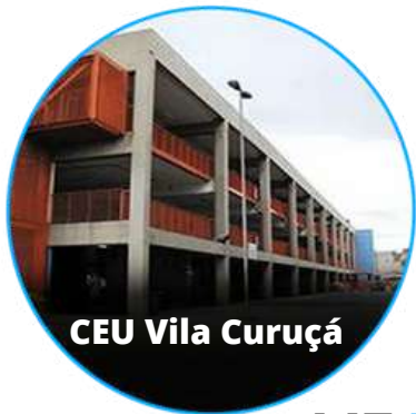
CEU Vila Curuçá