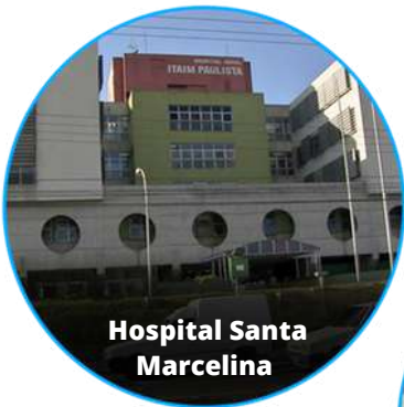
Hospital Santa Marcelina