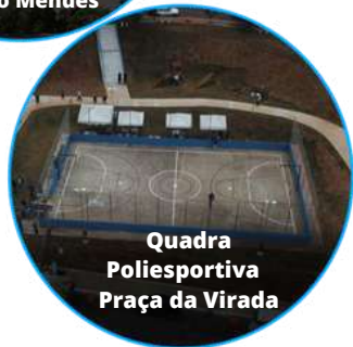
Quadra Poliesportiva Praça da Virada