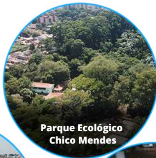
Parque Ecológico Chico Mendes