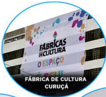
FÁBRICA DE CULTURA CURUÇÁ