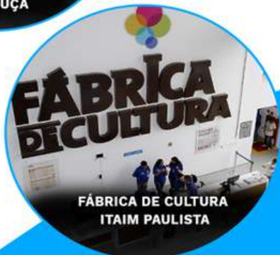
FÁBRICA DE CULTURA ITAIM PAULISTA