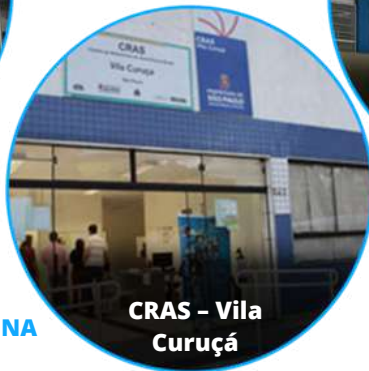
CRAS - Vila Curuçá

33 SERVIÇOS SOCIAIS 25 UNIDADES DE SAÚDE 01 HOSPITAL SANTA MARCELINA 01 REDE HORA CERTA