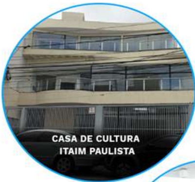
CASA DE CULTURA ITAIM PAULISTA