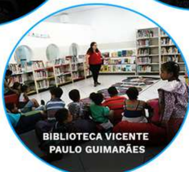
BIBLIOTECA VICENTE PAULO GUIMARÃES