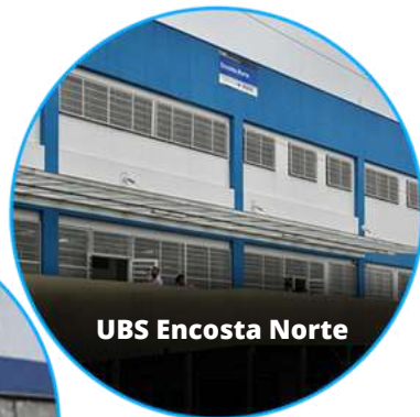
UBS Encosta Norte