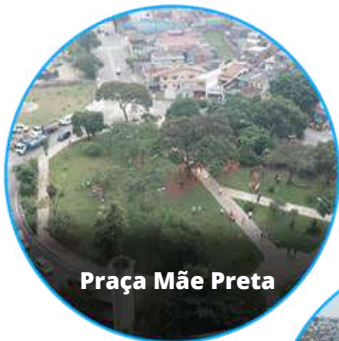
Praça Mãe Preta